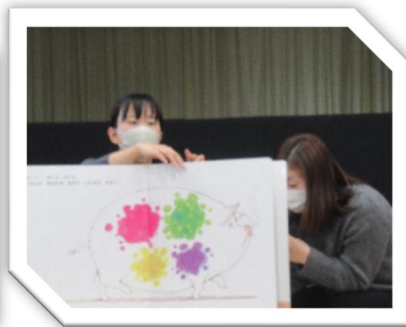
大型絵本(何を食べてきたの)