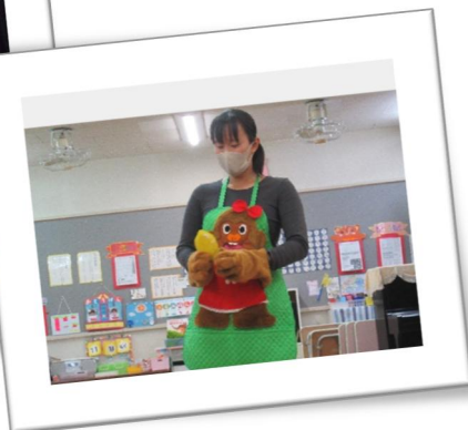
エプロンシアター(くいしんぼゴリラ)