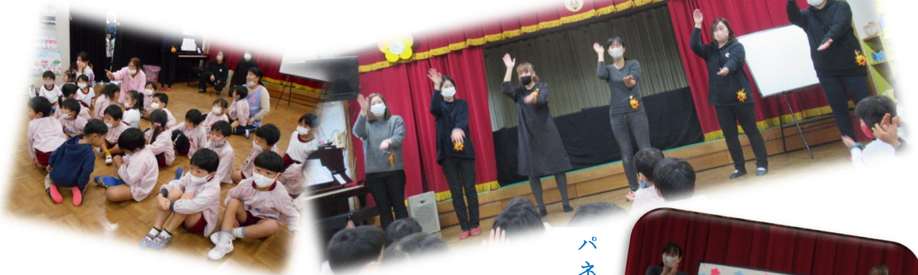
パネルシアター(ねこのおもしろいさん)