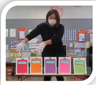
隠れている動物当てゲーム